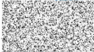
starosta Města Kutná Hora