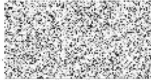
předsedkyně výboru Povídej, z.s.