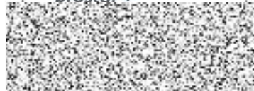
ředitel Prostor plus o.p.s.