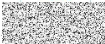
starosta Města Kutná Hora