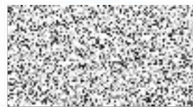
Radek Křivánek starosta obce Štipoklasy