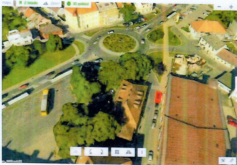
Situace 3D pohled