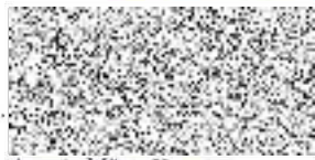
starosta Města Kutná Hora