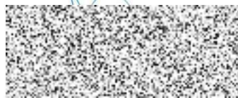
Ing. Karel Janák statutární zástupce Život plus, z.ú.

Za správnost dokumentu zodpovídá: Kontrola právníkem dne: 9.4.2021