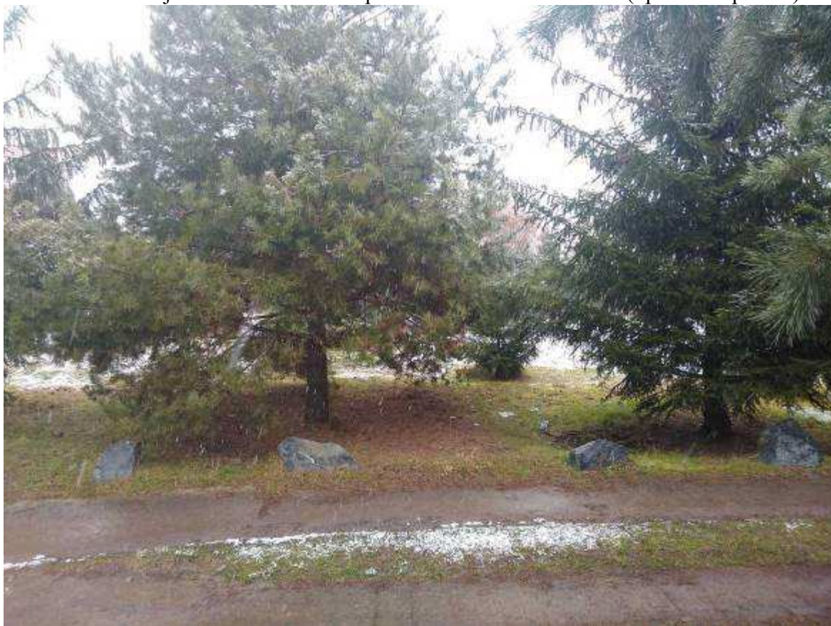
Pohled z pozemku 1968/3 na 1963/3. Hranice je na úrovni kamenů.