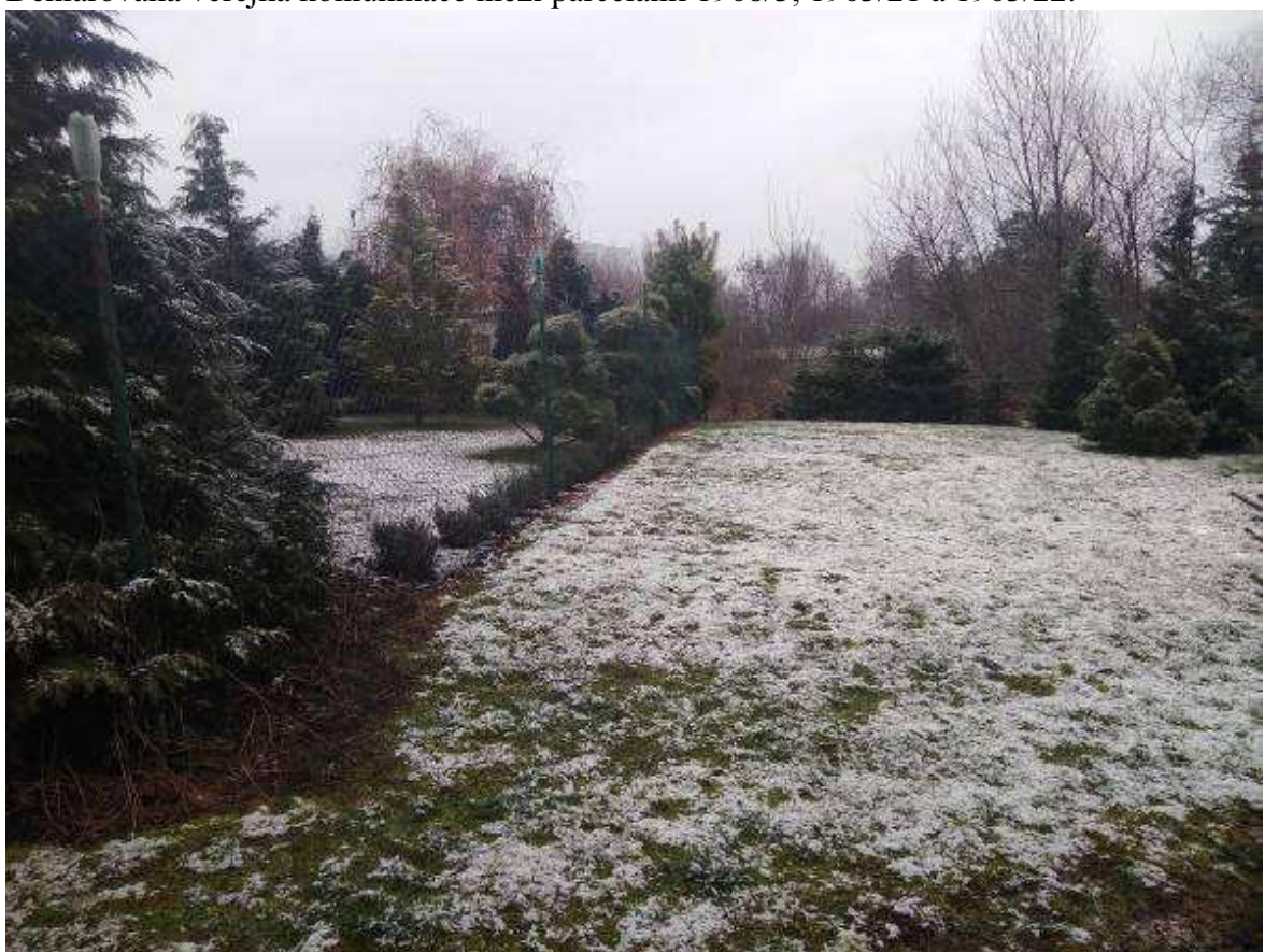
Deklarovaná veřejná komunikace mezi parcelami 1963/21 a 1963/22.