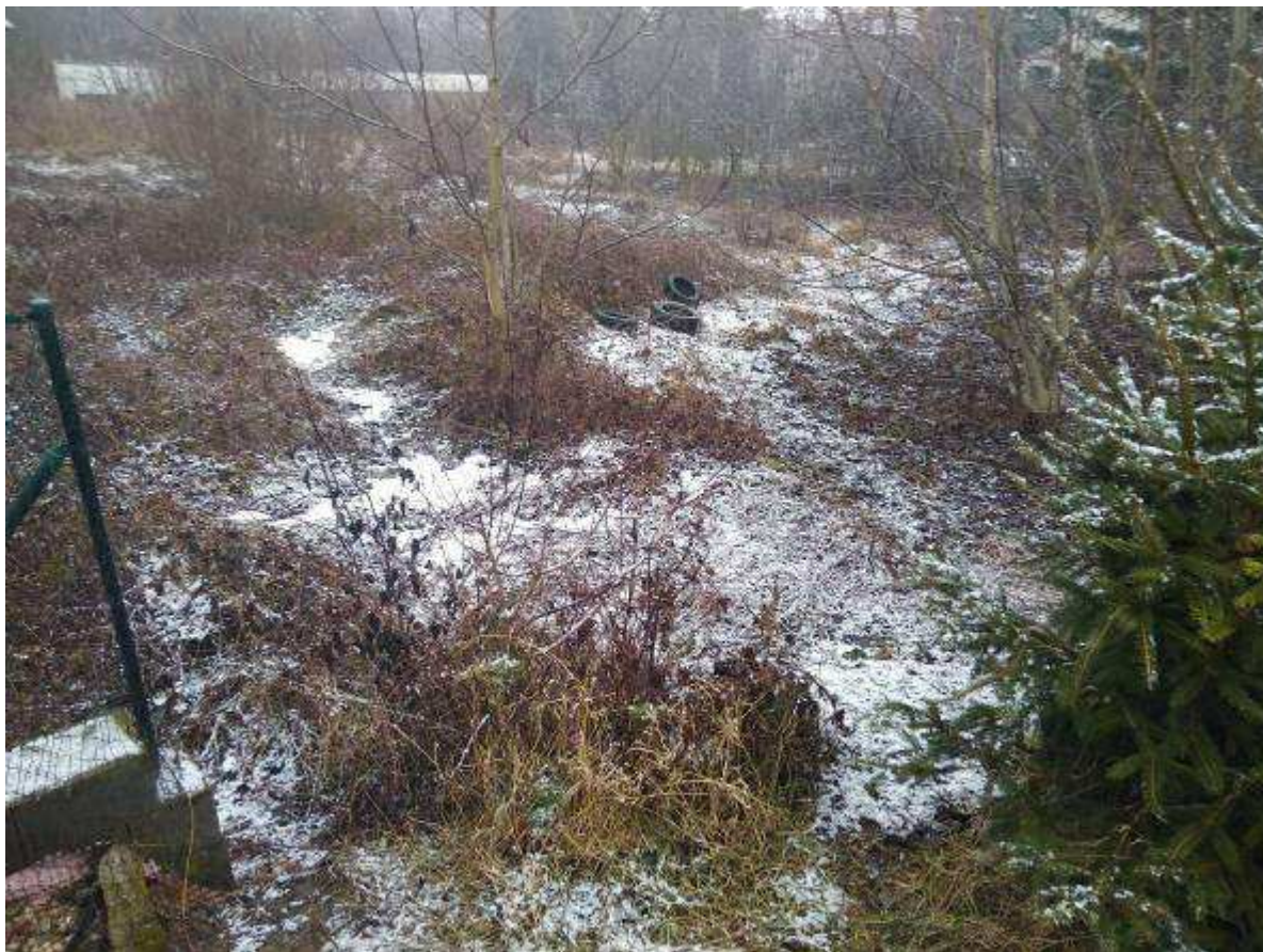
Deklarovaná veřejná komunikace mezi parcelami 1963/4 a 1963/2.