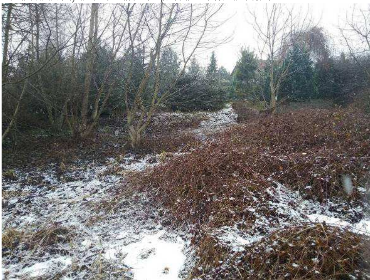
Deklarovaná veřejná komunikace mezi parcelami 1963/4 a 1963/2.