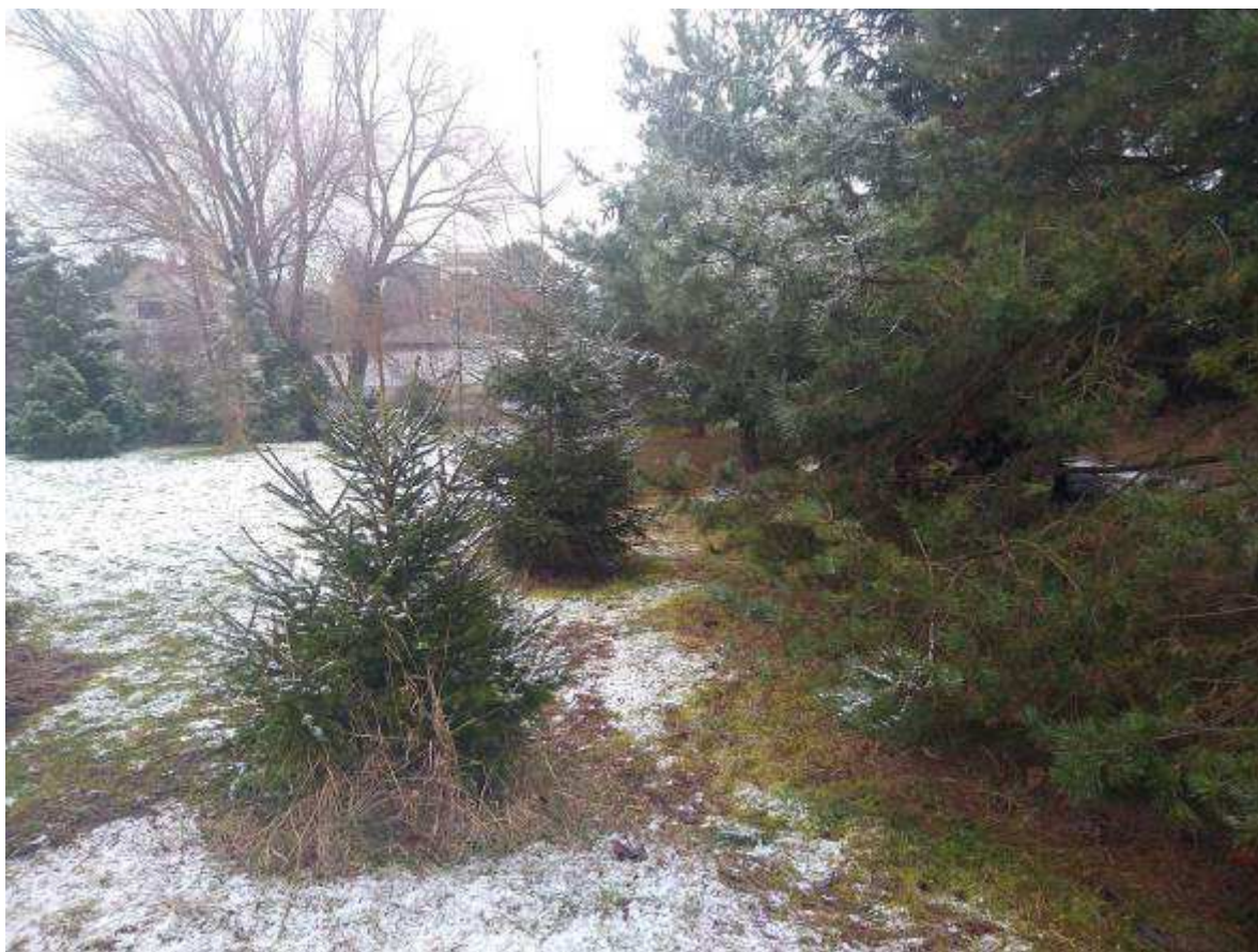
Deklarovaná veřejná komunikace mezi parcelami 1968/3, 1963/21 a 1963/22.