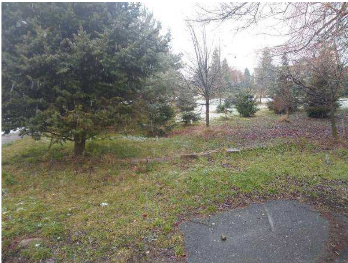
Deklarovaná veřejná komunikace mezi parcelami 1969/4 a 1963/22.