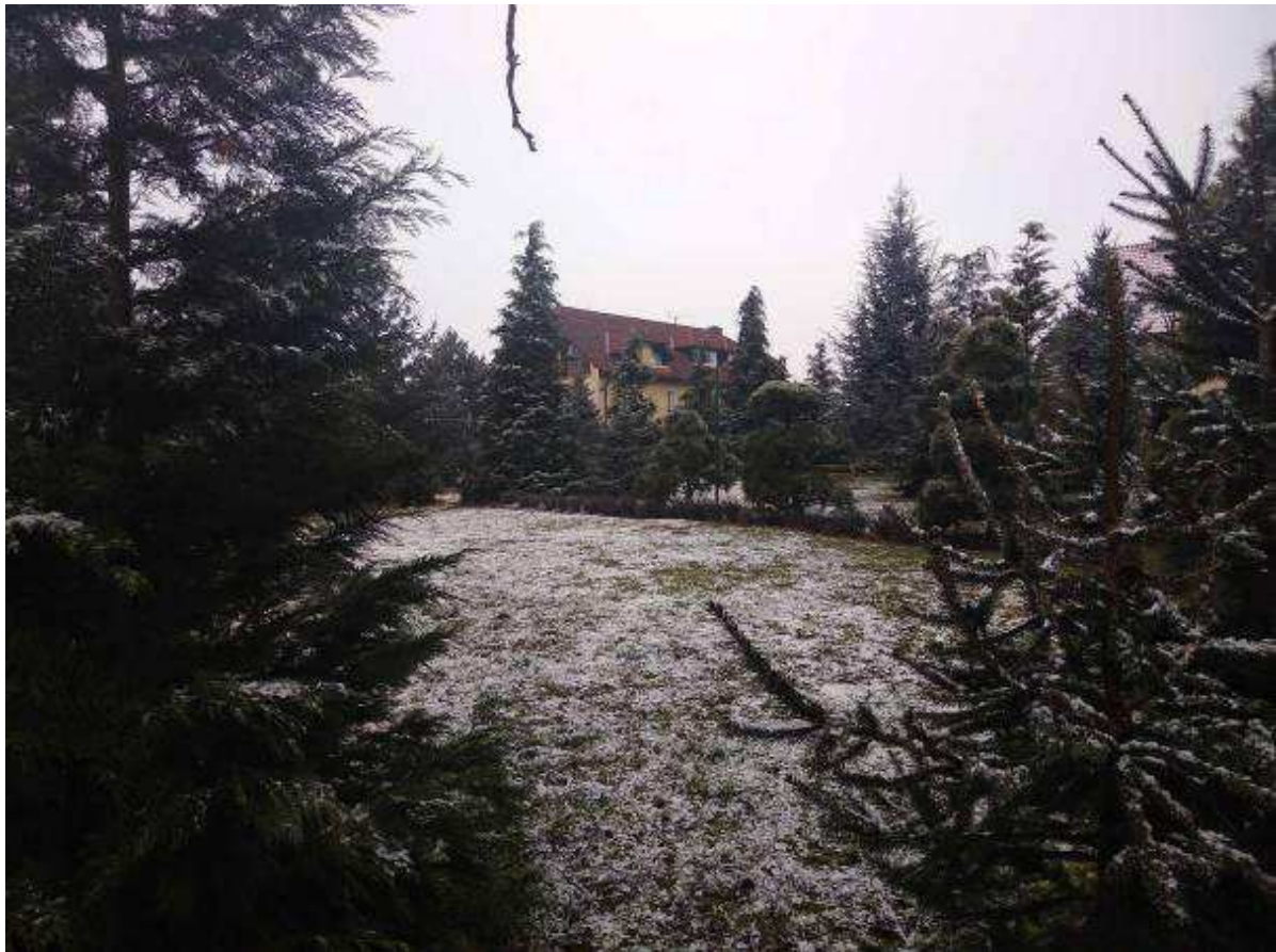
Deklarovaná veřejná komunikace mezi parcelami 1963/21 a 1963/22.