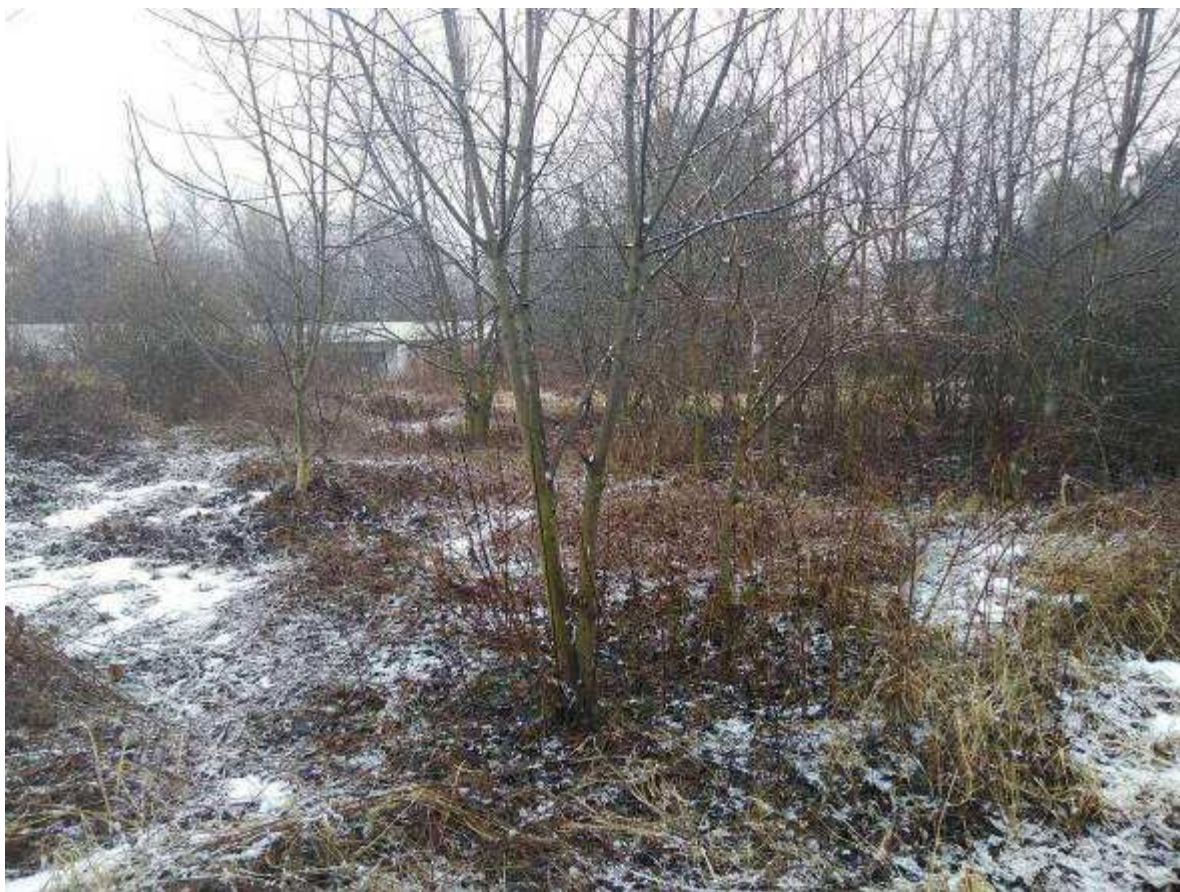
Deklarovaná veřejná komunikace mezi parcelami 1963/4 a 1963/2.