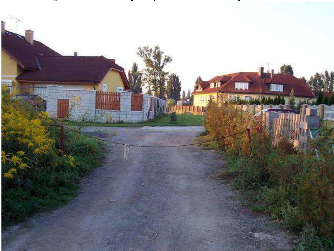
Řetězová zábrana brání vjezdu do lokality ze severu.