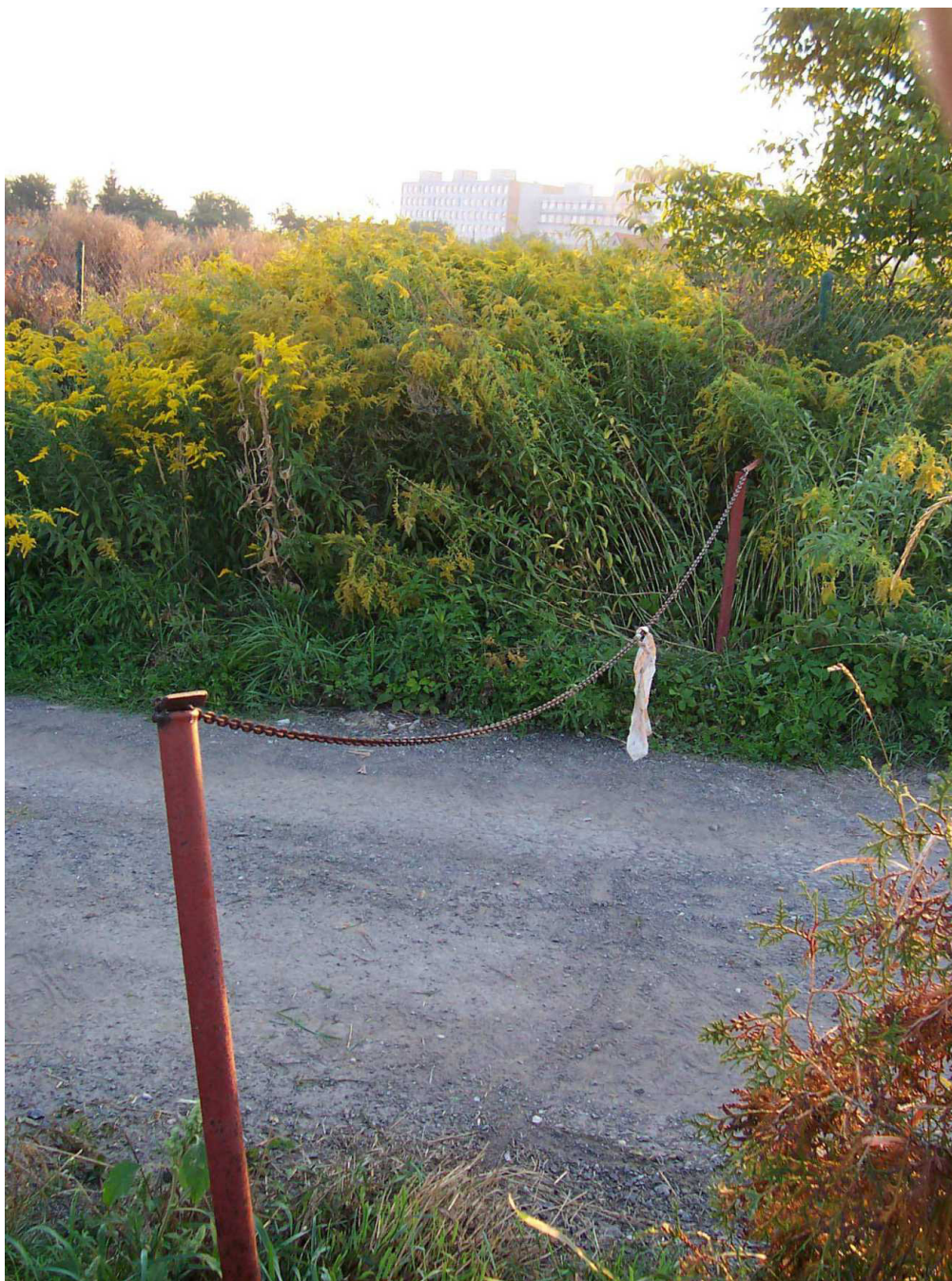
Řetězová zábrana bránící vjezdu do lokality ze severu.

b) V celém tomto vlastním řízení od samého počátku jasně tvrdím, že nesouhlasím s veřejným užíváním celého pozemku.