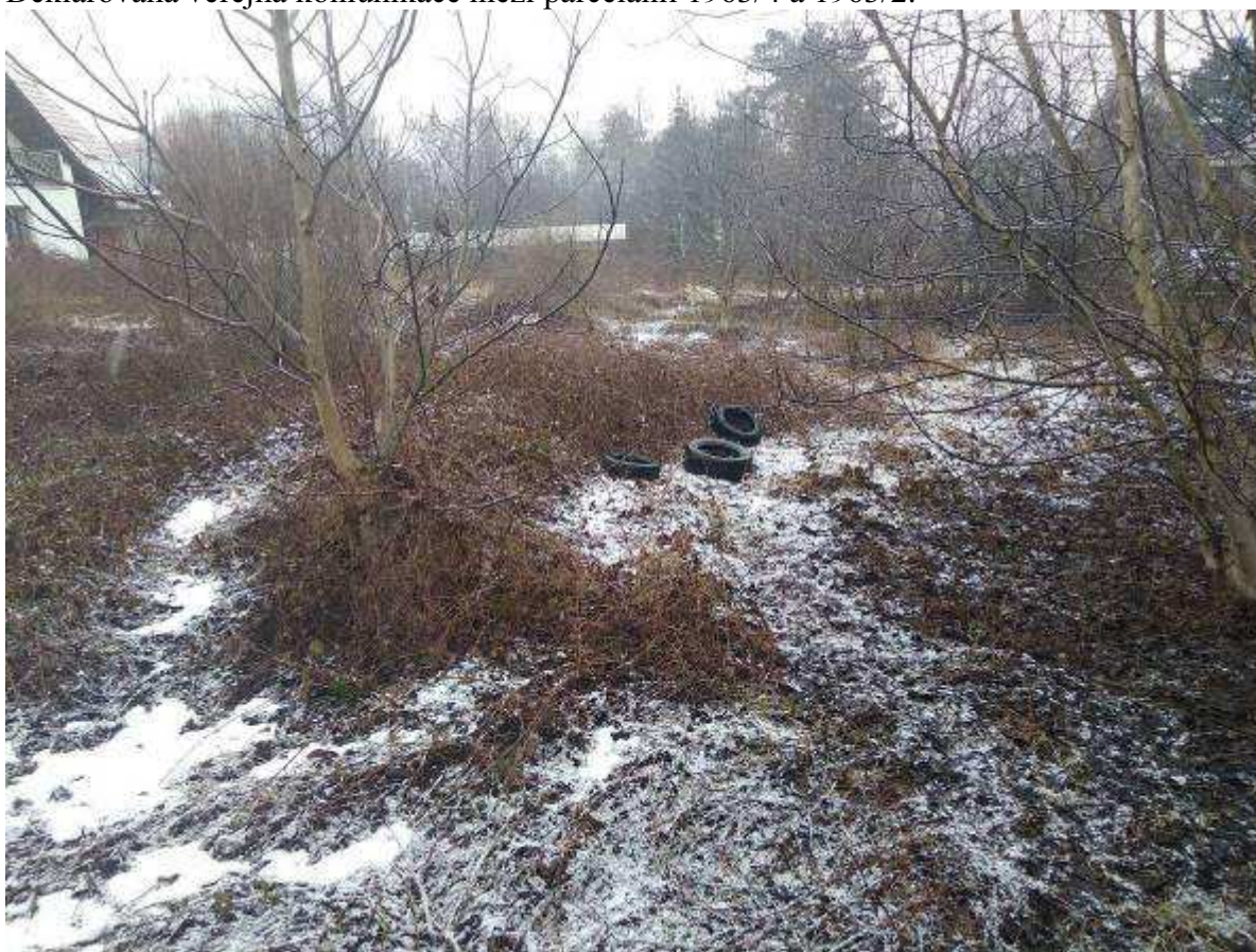
Deklarovaná veřejná komunikace mezi parcelami 1963/4 a 1963/2.