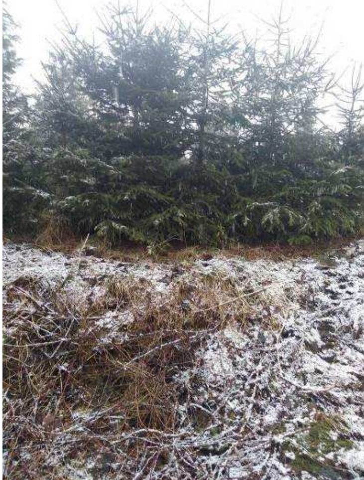
Mezi parcelami 1963/4 a 1963/2.