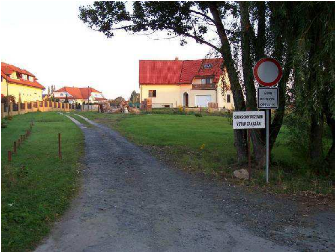
Fotografie z doby, kdy do lokality neexistoval jiný vjezd než tento z jihu Kromě cedule je vlevo vidět železný sloupek od řetězové zábrany.