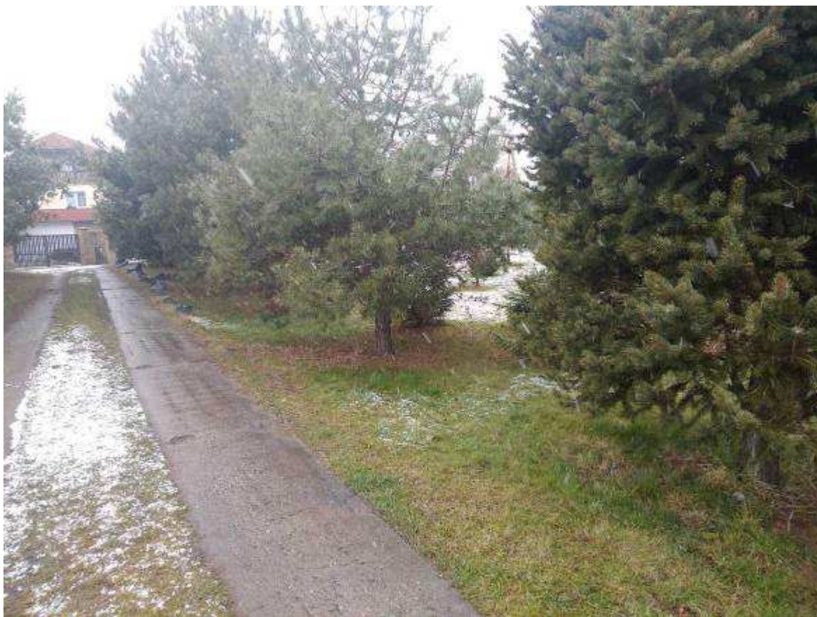
Deklarovaná veřejná komunikace mezi parcelami 1968/3 a 1963/22 (vpravo od panelů)