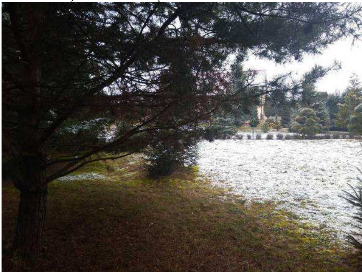
Deklarovaná veřejná komunikace mezi parcelami 1963/21 a 1963/22.