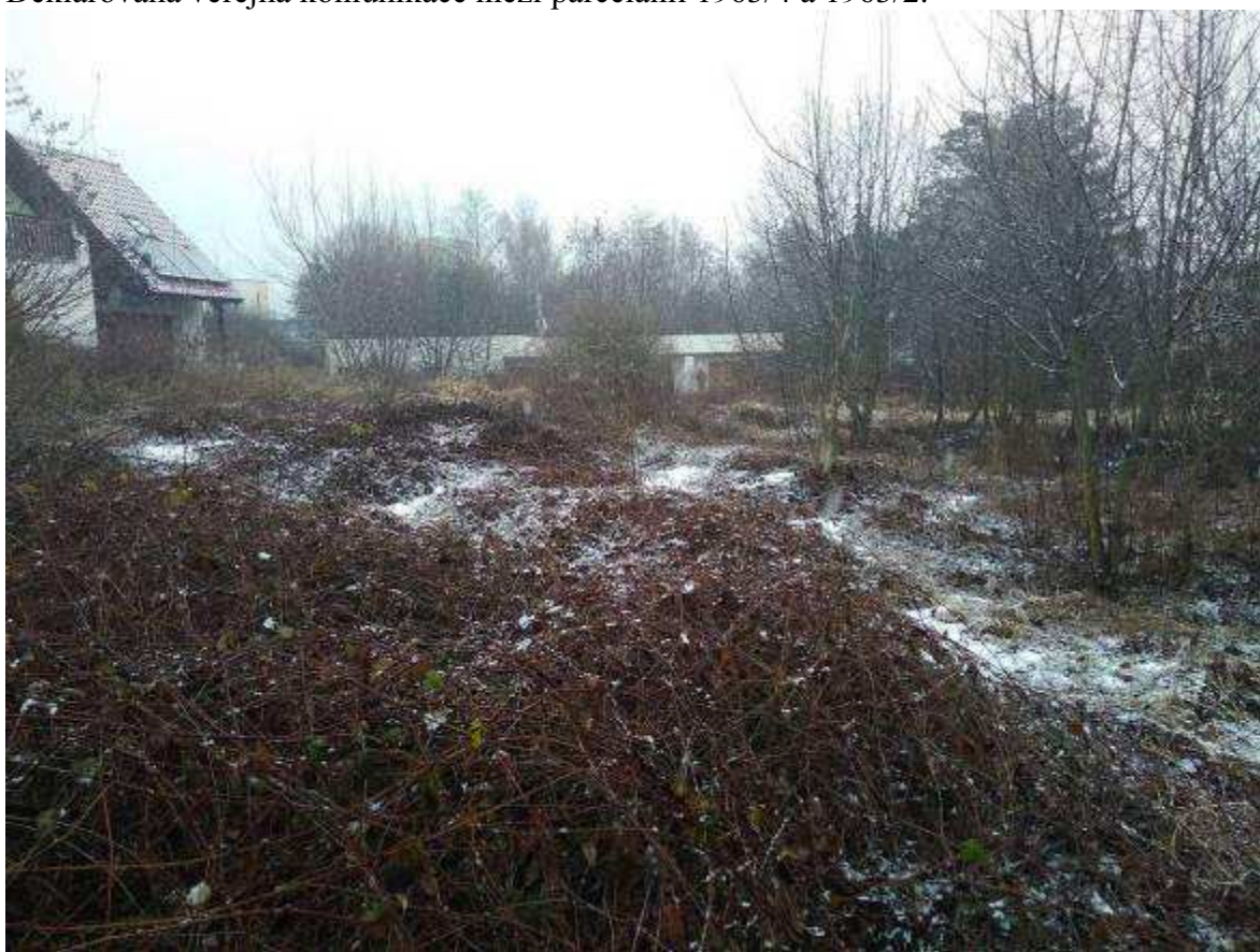
Deklarovaná veřejná komunikace mezi parcelami 1963/4 a 1963/2.