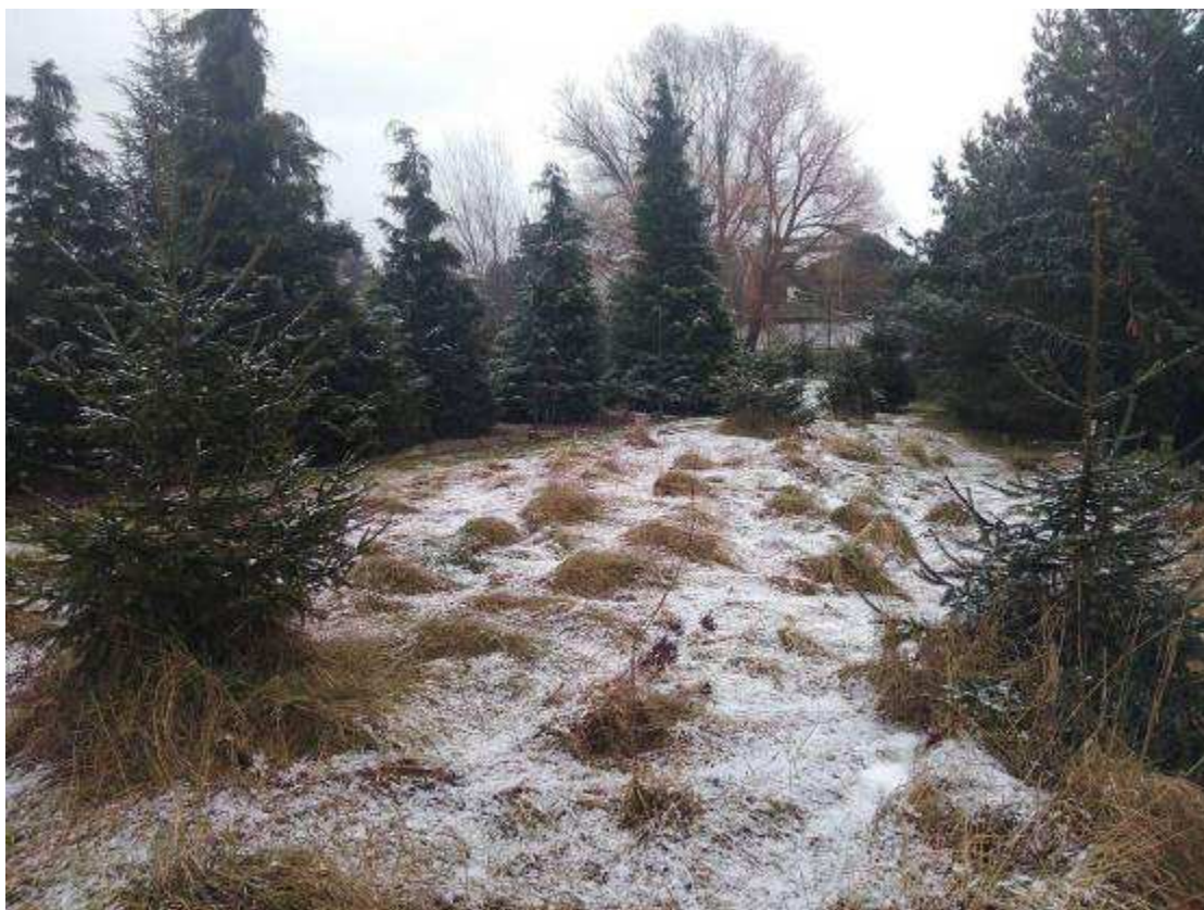
Deklarovaná veřejná komunikace mezi parcelami 1963/21 a 1968/15.