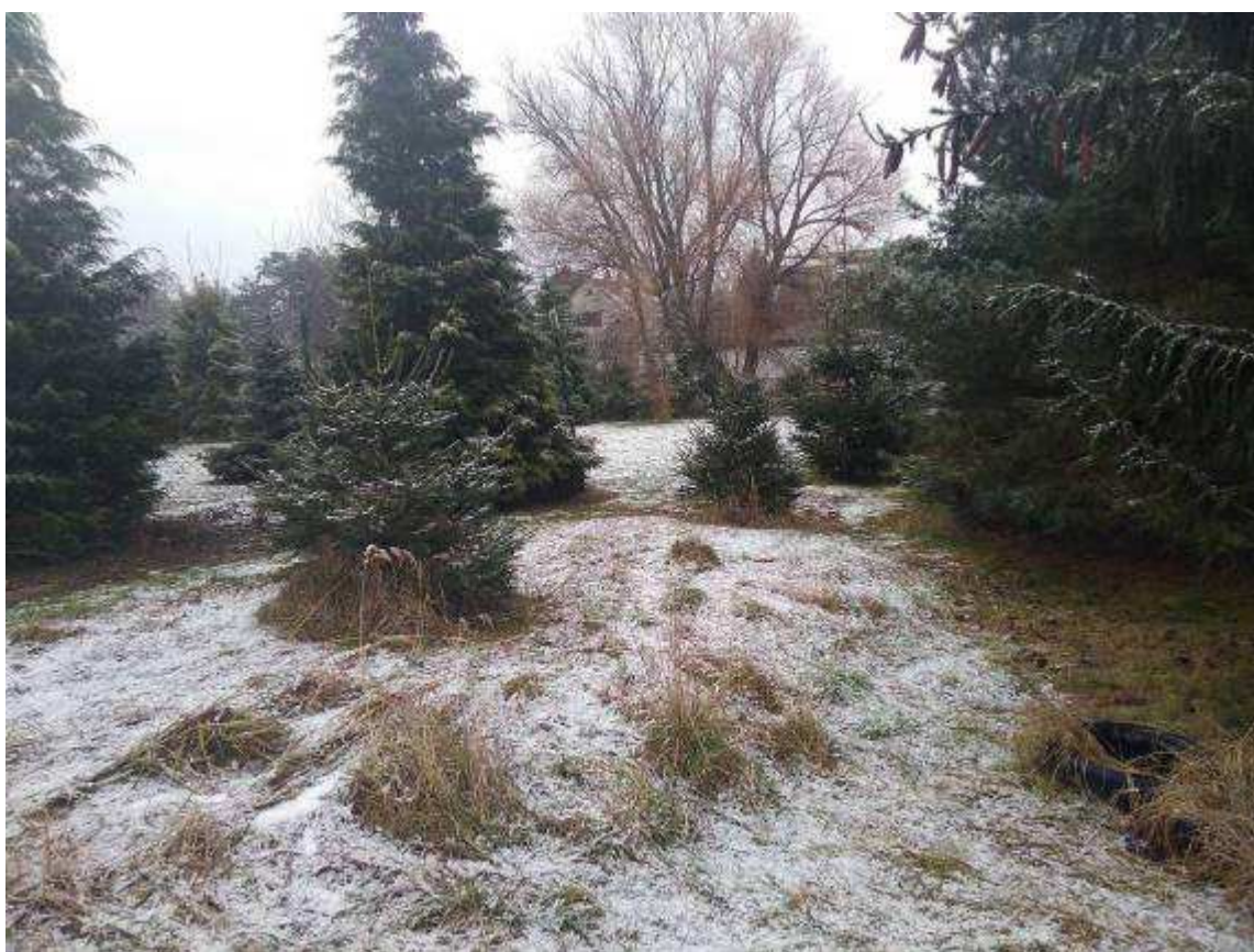
Deklarovaná veřejná komunikace mezi parcelami 1963/21 a 1968/15.