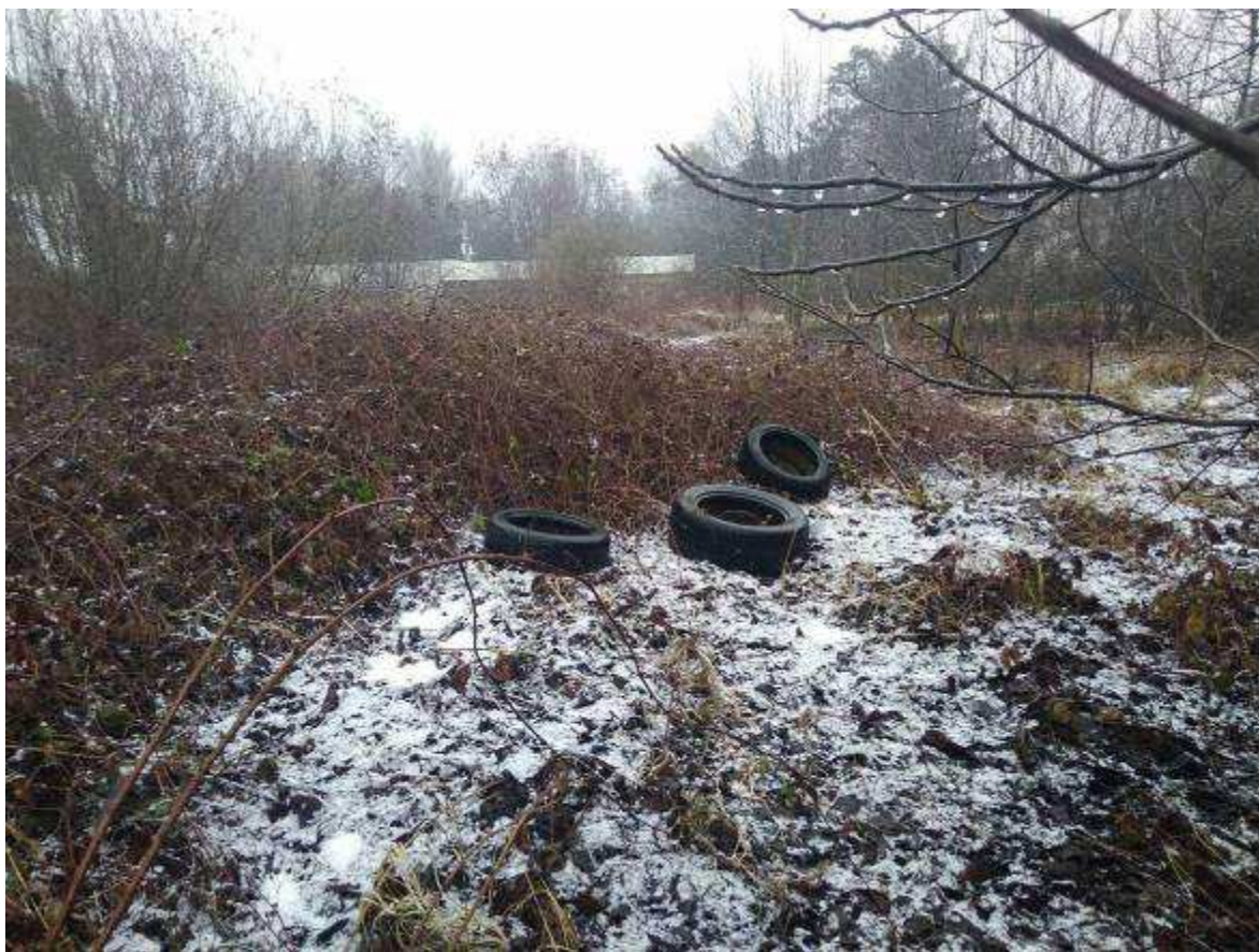
Deklarovaná veřejná komunikace mezi parcelami 1963/4 a 1963/2.