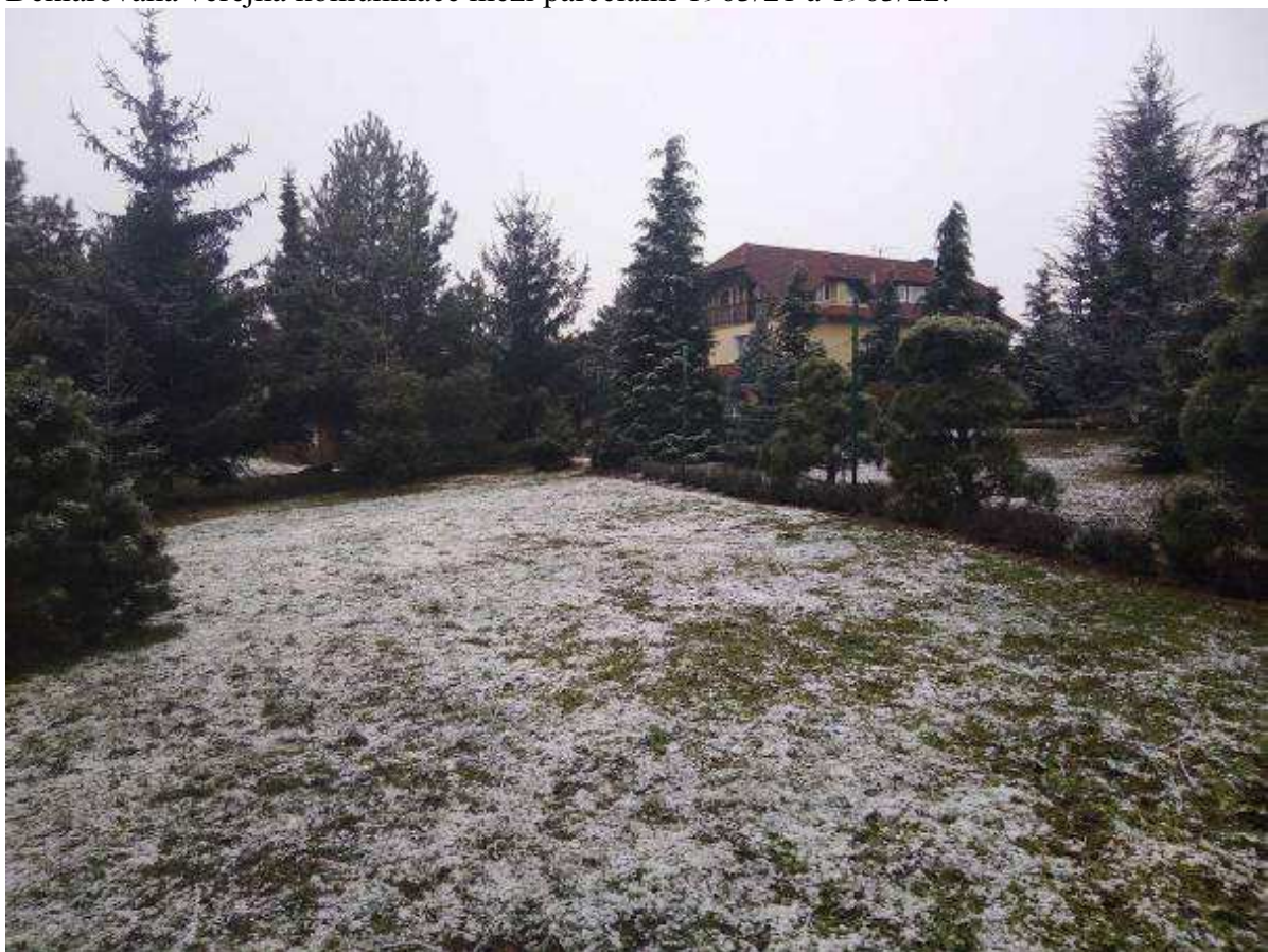
Deklarovaná veřejná komunikace mezi parcelami 1963/21 a 1963/22.