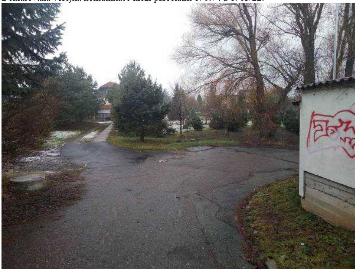
Deklarovaná veřejná komunikace mezi parcelami 1969/4 a 1963/22 z odstupu.