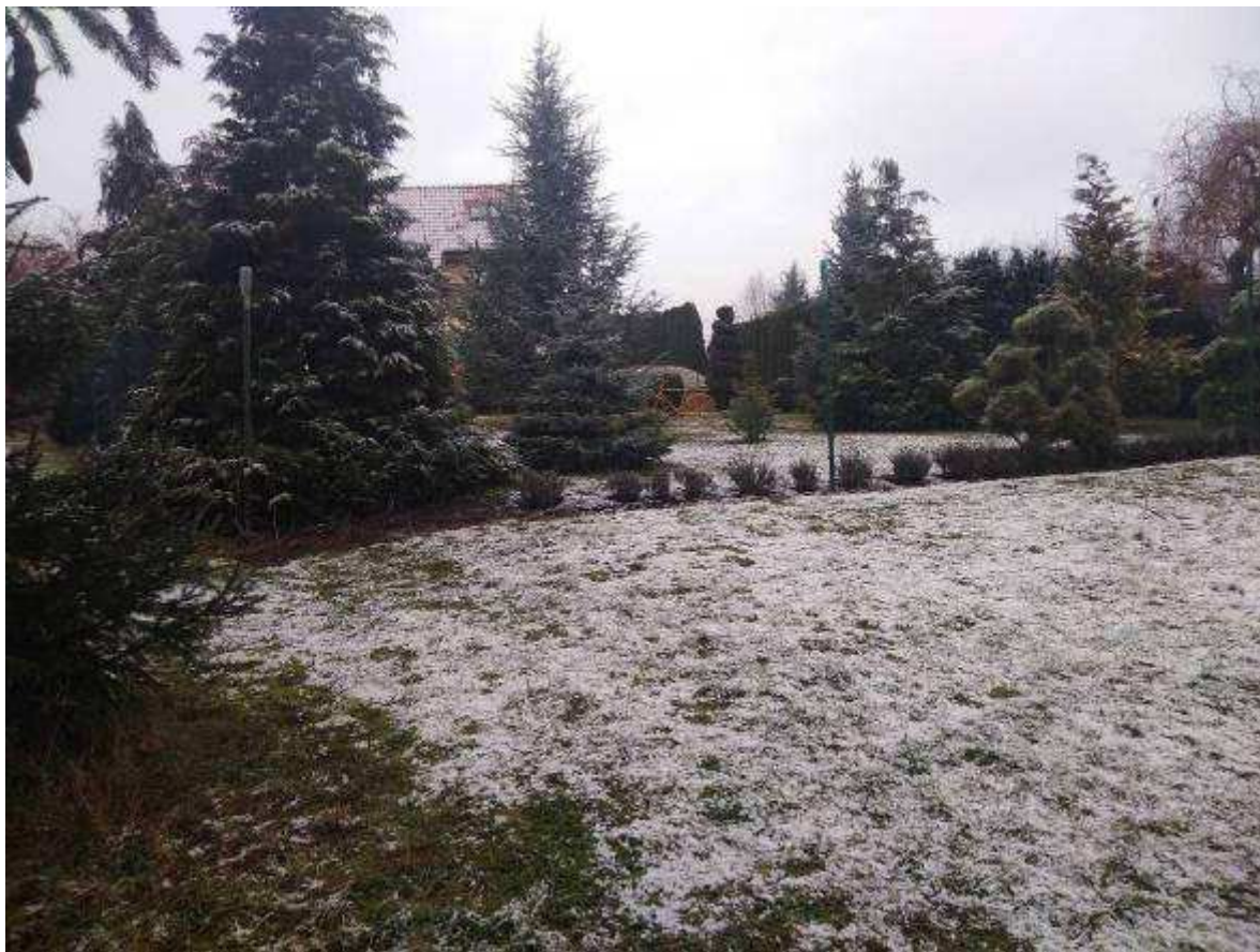
Deklarovaná veřejná komunikace mezi parcelami 1963/21 a 1963/22.