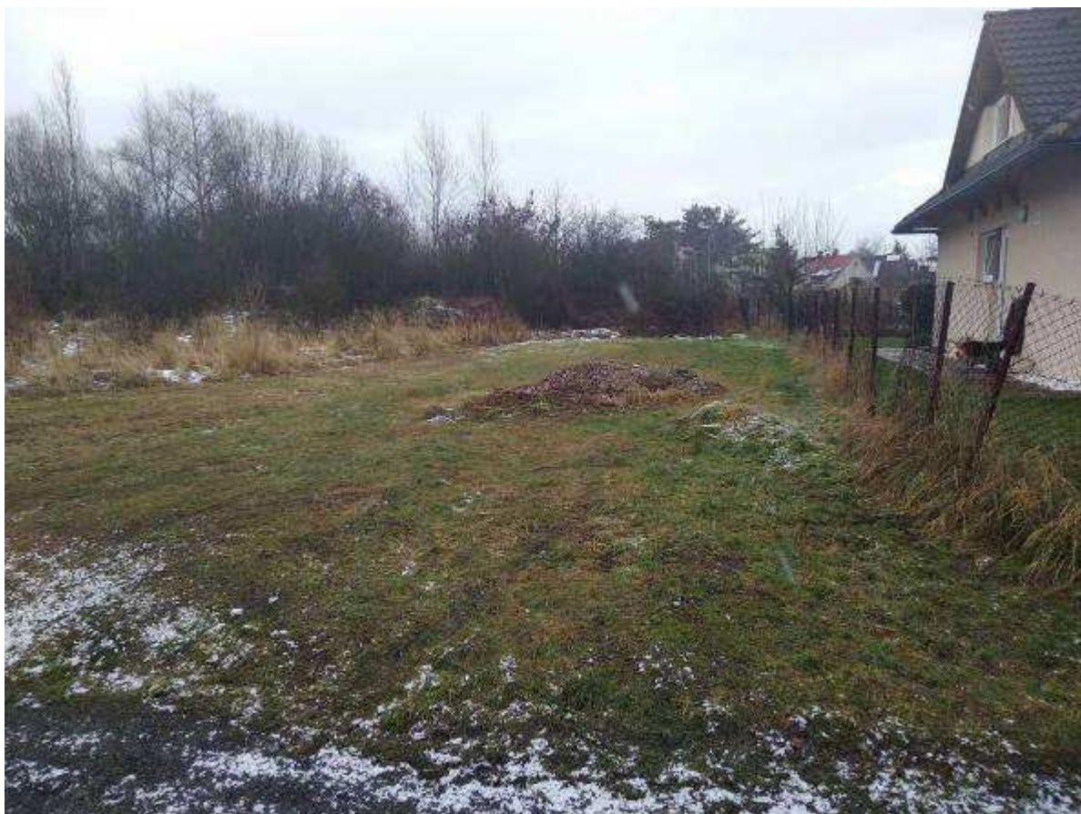
Deklarovaná veřejná komunikace mezi parcelami 1963/11 a 1963/12.