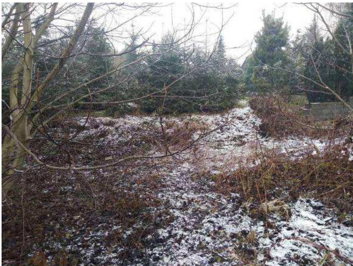
Deklarovaná veřejná komunikace mezi parcelami 1963/4 a 1963/2.