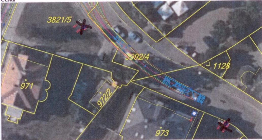
U Kamenného domu