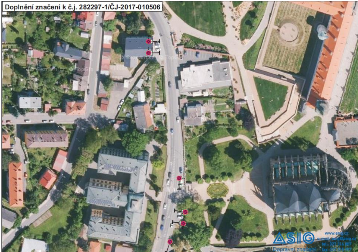
SCHEMATA PRO OZNAČENÍ PRACOVNÍCH MÍST V OBCE