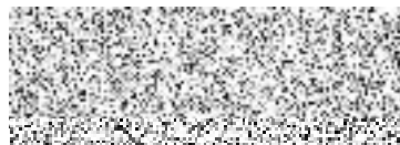
statutární zástupce Povídej, z.s.