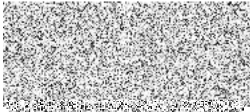
Mgr. Lukáš Seifert starosta Města Kutná Hora