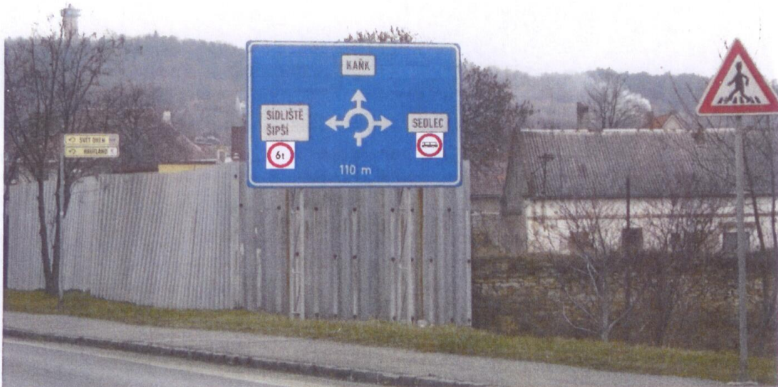
Nad Sady (směr od Kutné Hory ke Kaňku)

JIHLICIE CESKE HEVROBLIKY KRAJSKÉ ŘEDITELSTVÍ POLICE STŘEDNÍHO KRAJE OLČOVSKÁ KUTNÁ HORA KRAJSKÝ ÚŘAD POŠTOVNÍ SCHránKA 284 29 KUTNÁ HORA