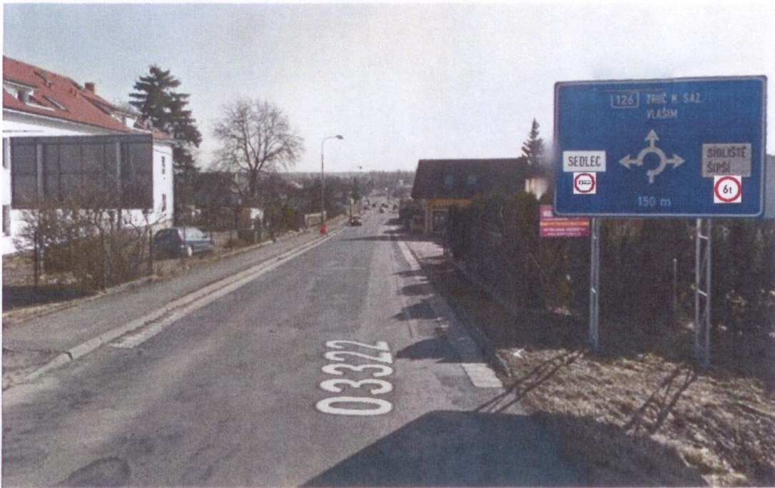
Nad Sady (směr od Kaňku do Kutné Hory)