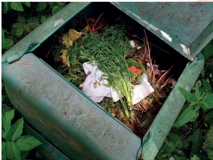
Organické zbytky rostlinného původu patří na kompost.

Bioodpad, tedy organické zbytky rostlinného původu, tvoří 40 až 60 % obsahu běžných popelnic na směsný odpad. Organickým zbytkům jsme se naučili říkat bioodpad. Není to však úplně šťastné pojmenování. Ze slova bioodpad máme pocit, že když se nám opravdu ocitne v rukách, je to něco co je třeba vyhodit a už se o to nestarat. Ale je to přesně naopak. Bioodpad není odpad! Je to cenná surovina, kterou můžeme dále využívat a kterou bychom s ohledem na životní prostředí využívat měli.