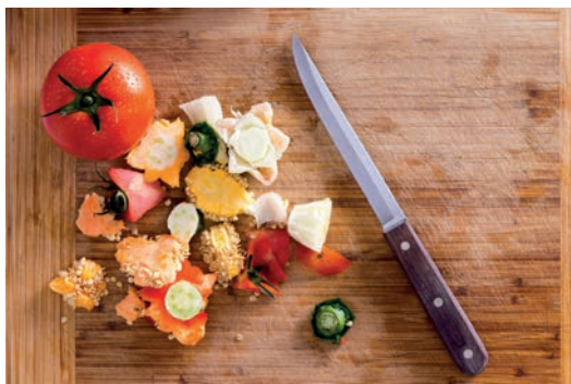
Třídění bioodpadu začíná v kuchyni