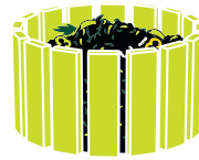
Kompost v komunitní zahradě