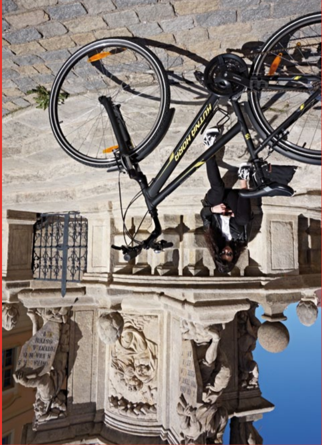
POHODA ♦ PŘÍRODA ♦ PAMÁTKY

Přijela vám návštěva a rádi byste jí zvali na prohlídku na okle krás- Chcete si vyrazit do přírody na kole, ale nemáte žádná k dispozici?