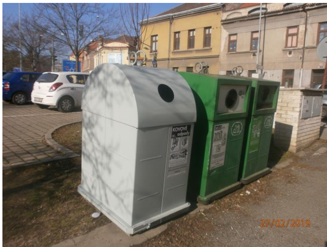
18. Šipší – Jana Palacha naproti čp.157