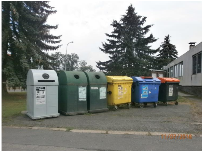
12. Hlouška – ulice Družební, 49°57'11.457"N, 15°16'39.176"E