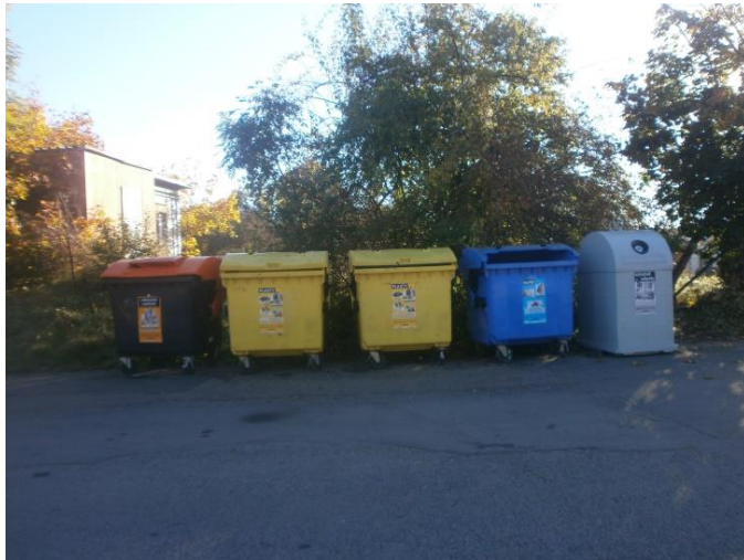
11. Neškaredice, 49°56'8.696"N, 15°18'37.789"E