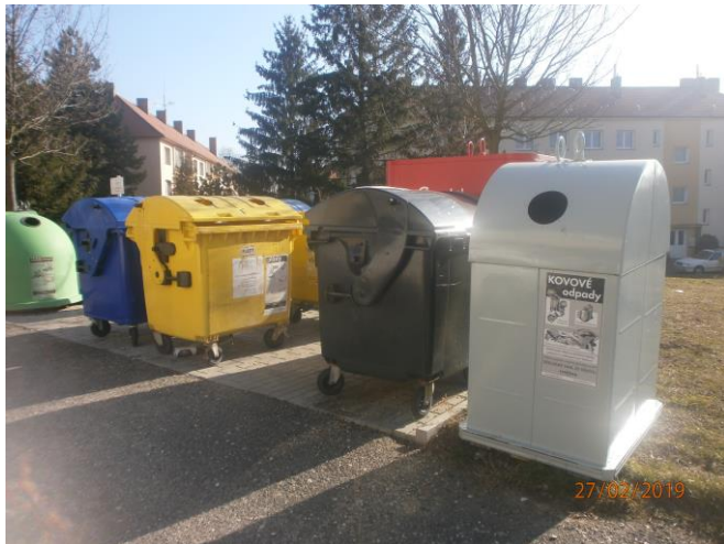
17. Hlouška – Štefánikova