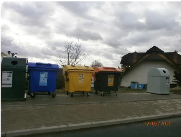
27. Šipší – Dolní (p.starosta 4/2020 požadavek)