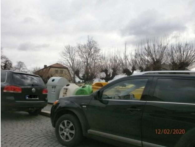
26. Sedlec – Pod Rozhlednou