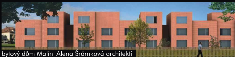
bytový dům Malín_Alena Šrámková architekti