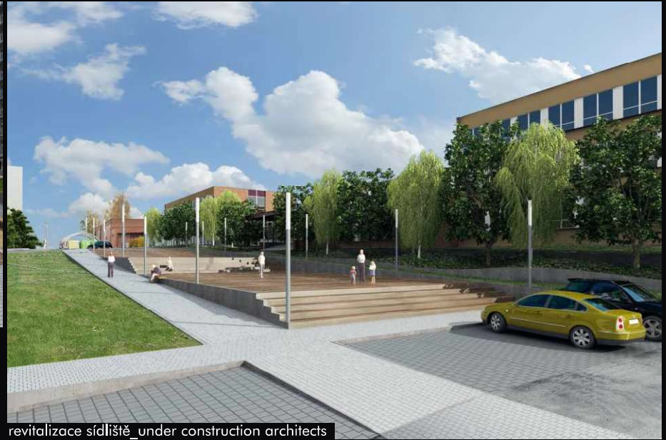
revitalizace sídliště_under construction architects