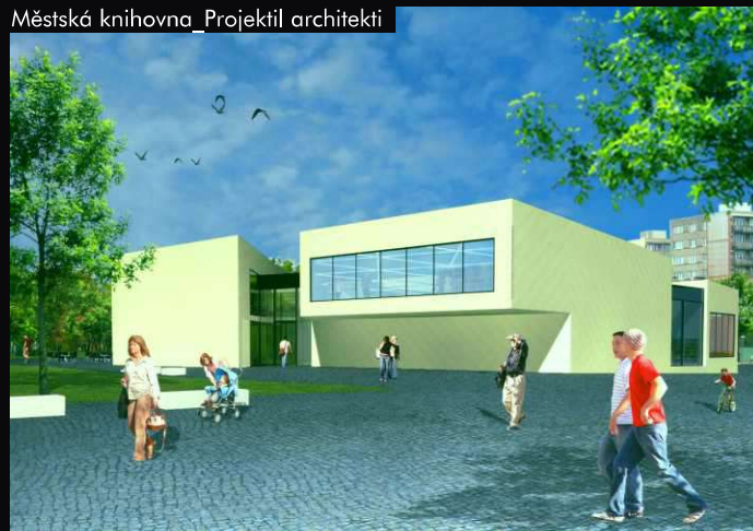
Městská knihovna_Projektíl architekti