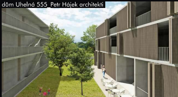
dům Uhebná 555_Petr Hájek architekti