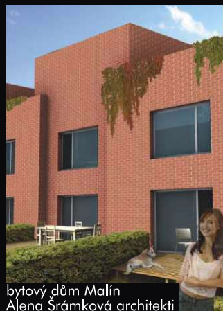
bytový dům Malín Alena Šrámková architekti