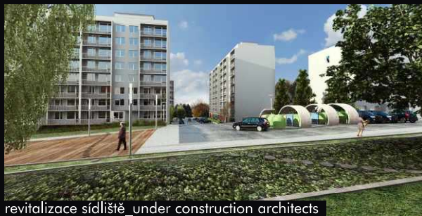
revitalizace sídliště_under construction architects