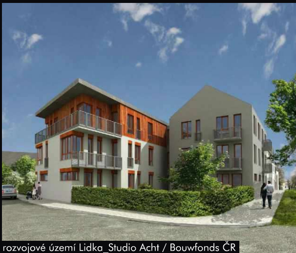
rozvojové území Lidka_Studio Acht / Bouwfonds ČR