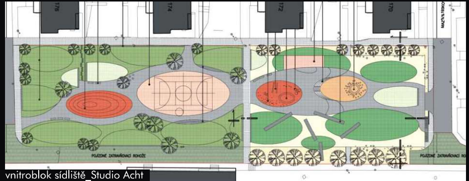
vnitroblok sídliště_Studio Acht