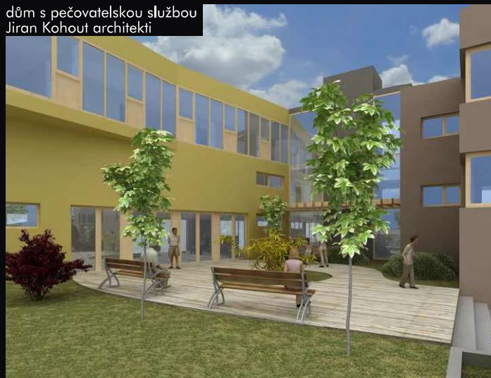
dům s pečovatelskou službou Jiran Kohout architekti