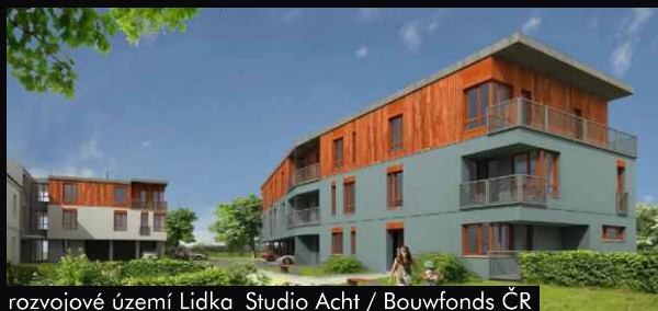
rozvojové území Lidka_Studio Acht / Bouwfonds ČR