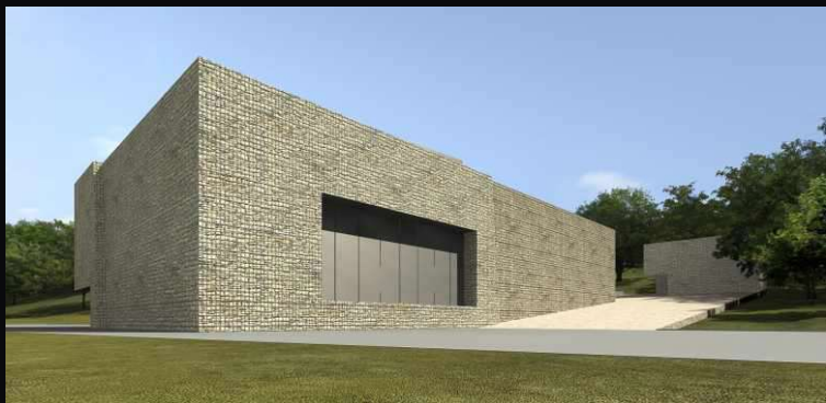
amfiteátr_Ivan Kroupa architekti