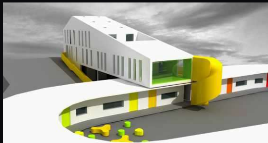
azylový dům_ander construction architects