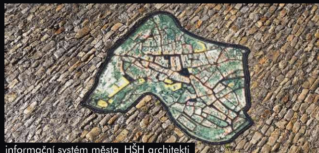
informační systém města_HŠH architekti