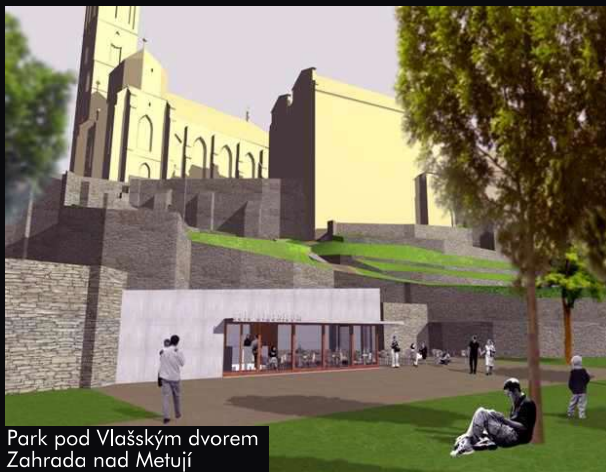
Park pod Vlašským dvorem Zahrada nad Metují