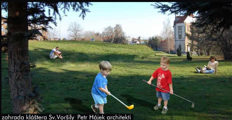
zahrada kláštera Sv.Voršily_Petr Hájek architekti