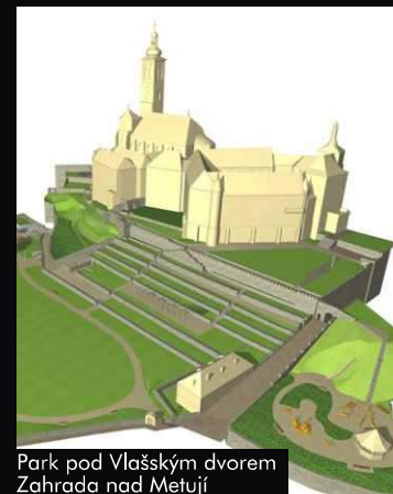
Park pod Vlašským dvorem Zahrada nad Metují