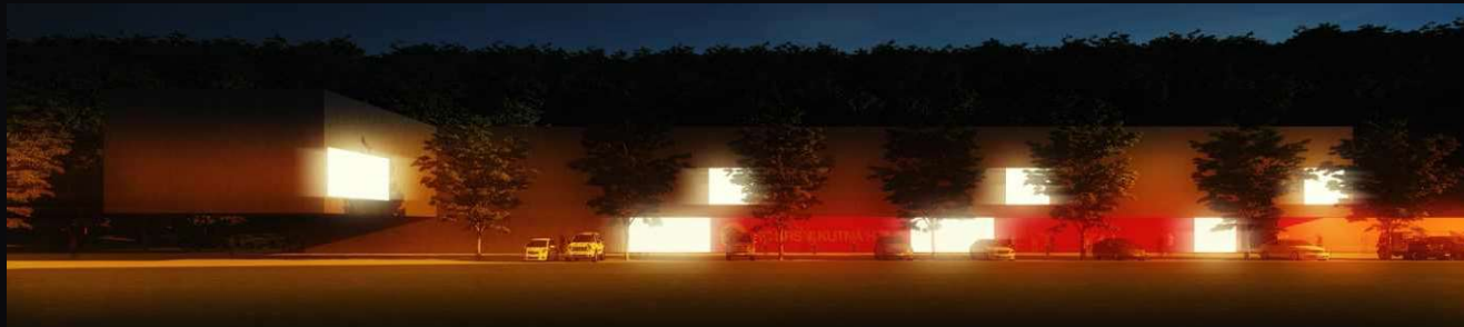
rekonstrukce zimního stadionu Ivan Kroupa architekti