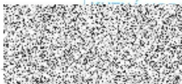
starosta Města Kutná Hora