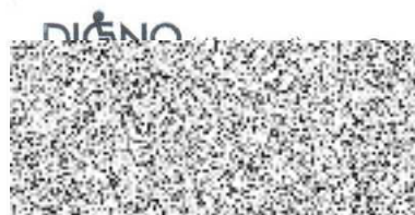
předsedkyně Digno (důstojnost) z.s.